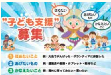
子ども支援の内容を募集中